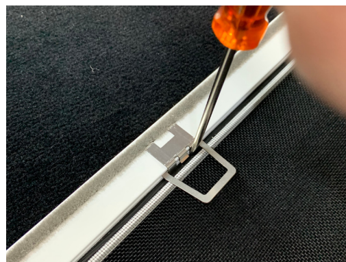
4. Keder vor die Haltenasen schieben. Haltenasen sollen hinter dem Keder liegen.