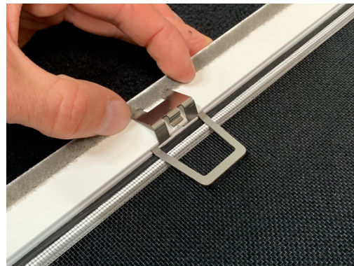
2. Clip platzieren und in Bürstenkanal einhaken.