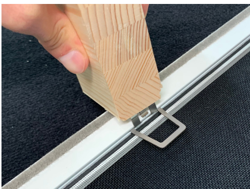
3. Clip einrasten (bei Bedarf Hilfsmittel, z.B. Holzklötzchen verwenden).